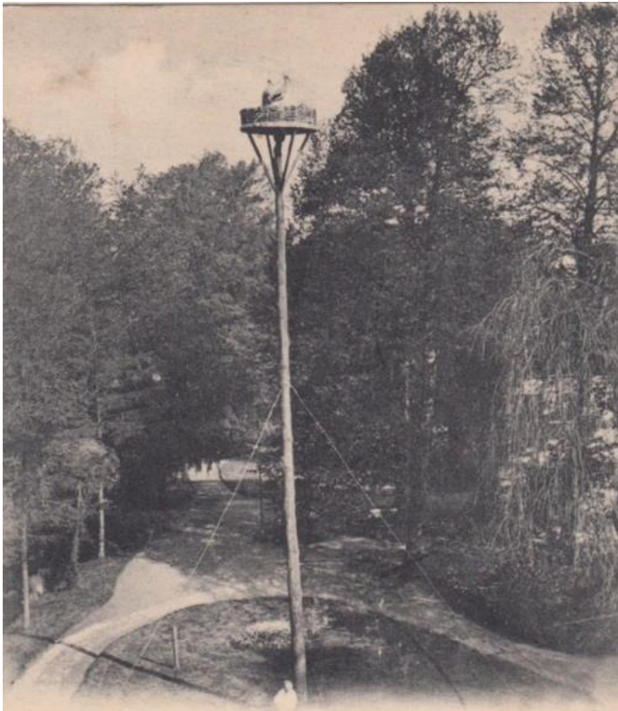
Ciconiae Sedes (Het tehuis van den Ooievaar) Slangevecht Breukelen