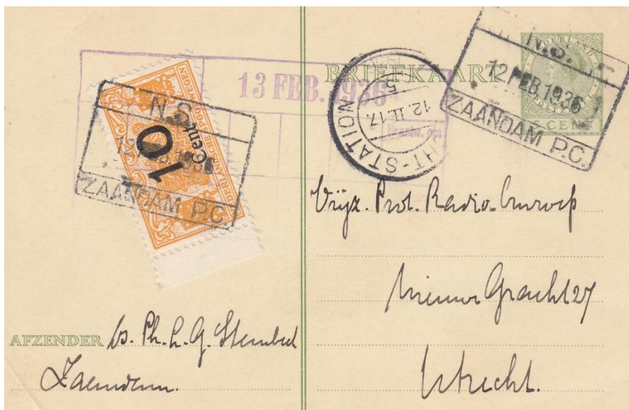
Zaandam, 12/2/1936, naar Utrecht. Aankomst zelfde dag. Stempel bagage bureau Zaandam Zegel recht N.S./ 10 cent

Met behulp van spoorwegzegels (“verantwoordingszegels”) werd dat op het poststuk verantwoord, volgens voorschrift (bij brieven) op de achterzijde, maar dat voorschrift werd vaak niet opgevolgd. Deze zegels werden vernietigd met het stempel van het bagagebureau, of met de pen door de conducteur. De zegels zijn in de literatuur uitvoerig gedocumenteerd op drukker, type, tanding en gebruiksmogelijkheden. Het boekje ‘Spoor en Post’ (Uitgave Spoorwegmuseum) is verplichte kost voor verzamelaars.