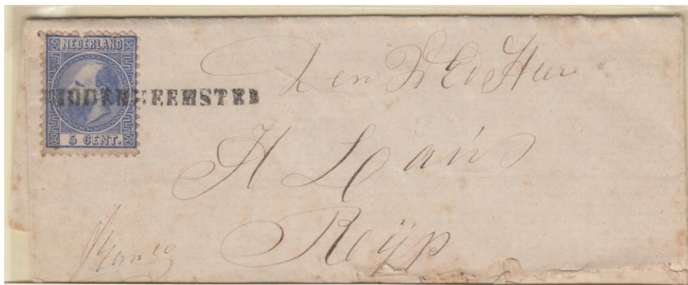
1869 Brief van Middenbeemster naar De Rijp

Een langstempel van Middenbeemster op een zegel van de derde emissie (op brief) zit ook in mijn verzameling, twee keer zelfs, maar die brieven zijn beide iets beschadigd. Toch is ook deze combinatie volgens mij zeldzaam: