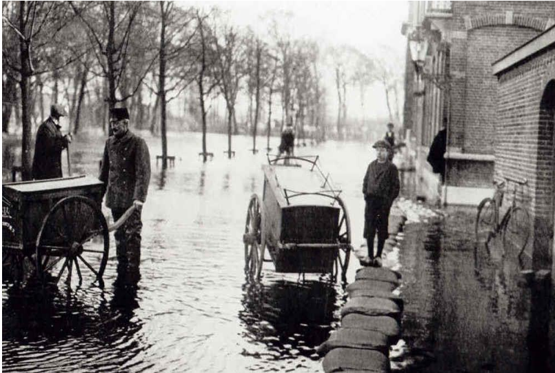
Het Purmerendse postkantoor tijdens de Watersnood van 1916

Orkest kon door de slechte weersomstandigheden geen doorgang vinden.